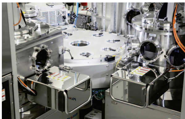
Вакуумный кластер PICOPLATFORM™ 200, состоящий из трех систем ACO PICOSUN™ P-300F Pro с механизмом вращения кассеты с пластинами в вакууме и центральным роботизированным манипулятором Brooks MX700™ (нижняя фотография).